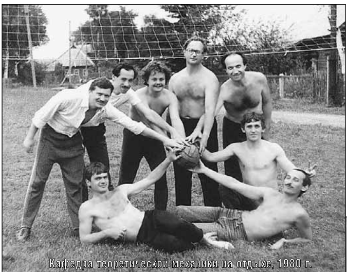
Кафедра теоретической механики на отдыхе, 1980 г.

Приказом Минвуза РСФСР в институте организованы авиамеханический, зияметаллургический и радиотехнический факультеты.