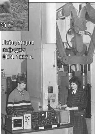
Лаборатория кафедры ОКМ, 1995 г.

Госкомитет РФ по высшему образованию изменил статус рыбинского вуза. Отныне он стал именоваться Рыбинской государственной авиационной технологической академией.