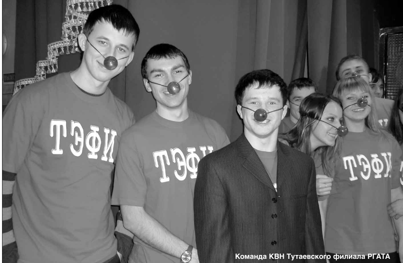
Команда КВН Тутаевского филиала РГАТА